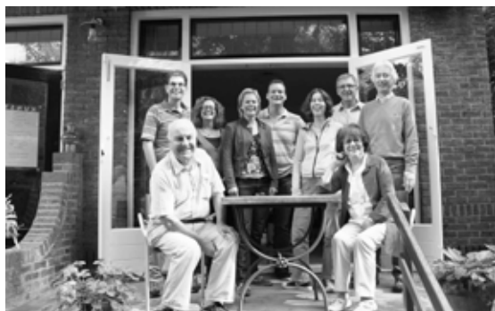
het bestuur geïnspireerd op naar 2012