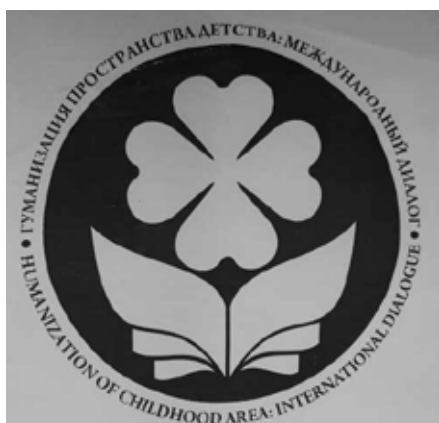
Thema van de conferentie: 'Humanization of childhood area'